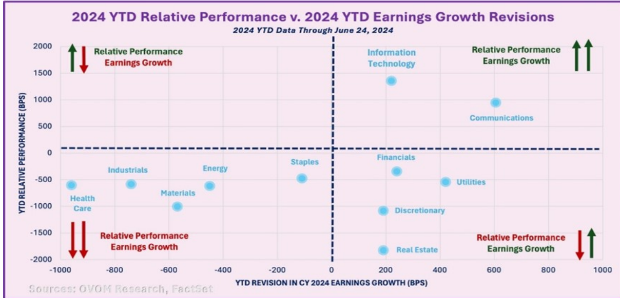
Grafico 2: 2024 YTD Relative Performance v. 2024 YTD Earnings Growth Revisions, OVQM Research

Il grafico a dispersione di cui sopra, mostra la relazione tra la performance del settore da inizio anno e le revisioni degli utili per gli 11 settori dell'indice azionario americano S&P 500. Fortunatamente il quadrante in alto a sinistra è vuoto, ovvero non presenta settori il cui prezzo non è giustificato dai guadagni.